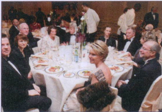
W wydarzeniu jak co roku wzięli udział przedstawiciele polskich i zagranicznych elit: ambasadorzy i konsulowie rezydujący w stolicy Europy, posłowie Parlamentu Europejskiego, a także belgijscy przedsiębiorcy i touroperatorzy oraz media

przedstawiciele biznesu, polityki i arystokracji jak co roku spotkali się na balu Polskim w Brukseli.